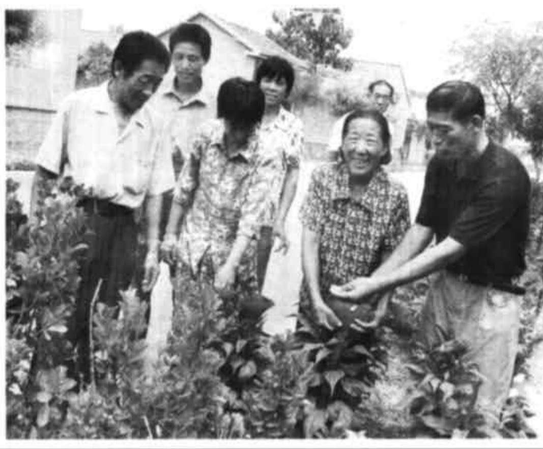
广饶县丁庄镇万二庄村在搞好村庄规划的同时,不断加强配套设施建设,对村内街道的路边沟进行了衬砌,修建了排水沟和栽有各种花卉的花圃,居住环境与城里的居民小区相媲美。群众高兴地说:“我们老百姓也住进了居民小区。”图为村两委一班人在与群众一起察看花卉的生长情况。