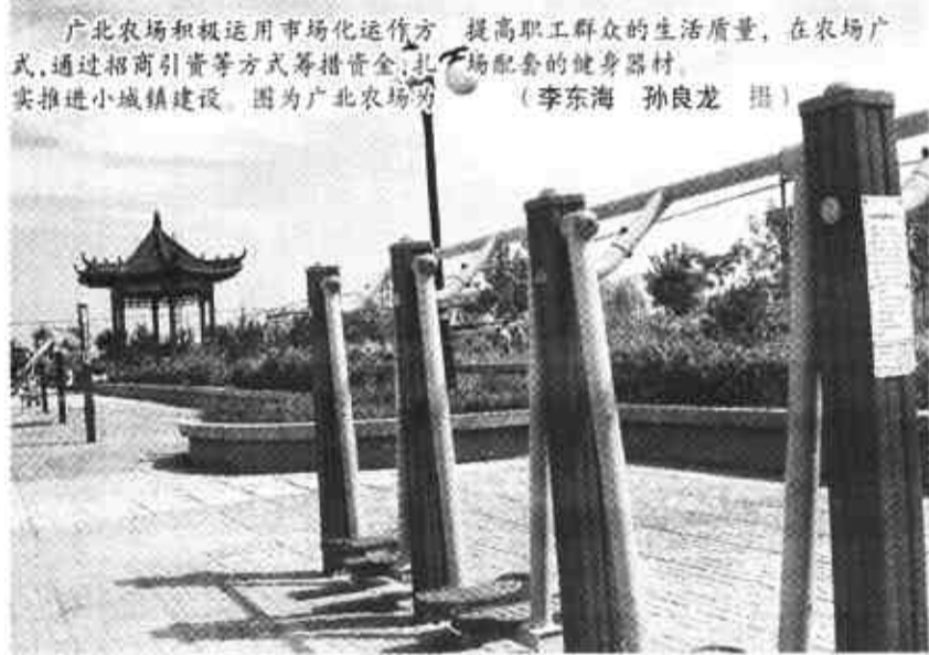
广北农场积极运用市场化运作方式，通过招商引资等方式筹措资金，建设配套的健身器材，实推进小城镇建设，图为广北农场。

学工程款4.2万元，为21名品学兼优、生活困难且考入本科院校的应届高中毕业生提供资助。该区财政还每年拨付6万元资金用于扶贫助学。目前为止，该区共共有93个单位的职工捐款135560元投入基金帐户，40余个单位及个人自行捐助建立基金171970元。 扶贫扶志。团区委与受助生建立了联系卡，定期走访，与受助生沟通感情，交流思想。建立了特困生动态管理档案，及时将贫困生的学习生活情况反馈给资助者，适时组织“扶贫助学见面会”。 (记者 薄纯阳 通讯员 王玉广 高立燕)