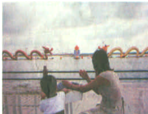
“二龙戏珠”让游客驻足观看。