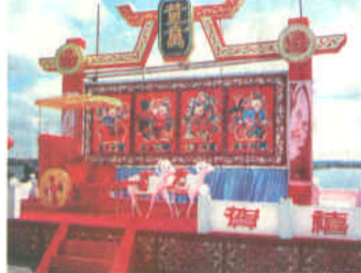
游人可坐在小车上拍照的“金羊贺福”。