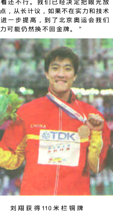
刘翔获得110米栏铜牌

在参赛技巧方面，冯树勇也有自己的心得：“本来按照我们队员的报名成绩和外国的选手比，不会有这么多人进入决赛，甚至前8名。”