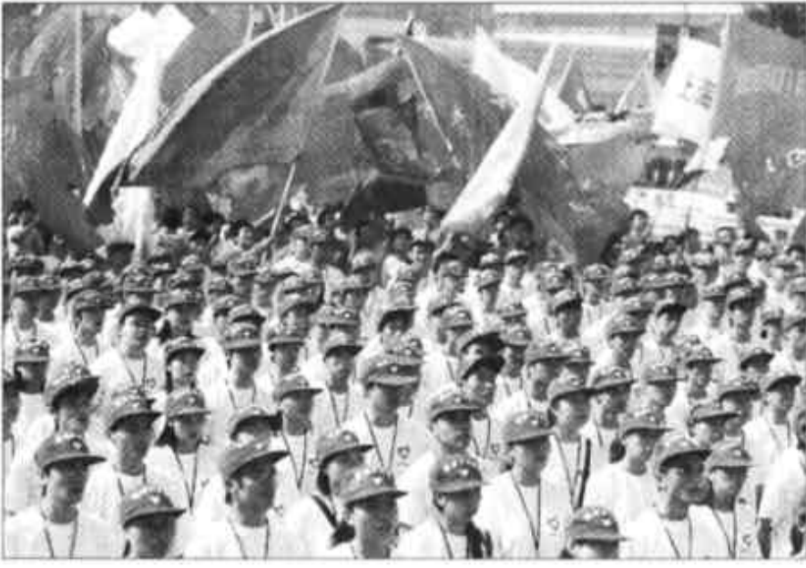
8月31日，300多名大学生志愿者代表和首都高校一千名大学生志愿者在北京中华世纪坛高唱《西部歌》。当日，2003年全国大学生志愿服务西部计划出征仪式在北京中华世纪坛举行，参加“西部计划”和“百县千乡宣传文化工程”的205名首都大学生志愿者启程奔赴内蒙，进行一到两年的志愿服务。

新华社北京8月31日电 国务院日前发出关于促进房地产市场持续健康发展的通知，新华社31日全文播发了这个通知。 通知共分六部分，分别为：提高认识，明确指导思想；完善供应政策，调整供应结构；改革住房制度，健全市场体系；发展住房信贷，强化管理服务；改进规划管理，调控土地供应；加强市场监管，整顿市场秩序。 通知要求各地、各部门完善住房供应政策，加强经济适用房的管理和建设，增加普通商品住房供应，建立和完善廉租住房制度，控制高档商品房建设。在改革住房制度方面，通知要求各地继续推进现有公房出售，完善住房补贴制度，同时搞活住房二级市场，规范发展市场服务。在规范住房信贷方面，通知强调要加大住房公积金归集和贷款发放力度，完善个人住房贷款担保机制，加强房地产贷款监管。此外，通知还在完善市场监管制度，建立健全房地产市场信息系统和预警预报体系、整顿和规范房地产市场秩序方面作了详细规定。